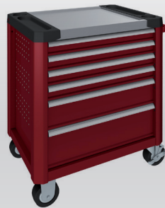
Rouge rubis RAL 3003