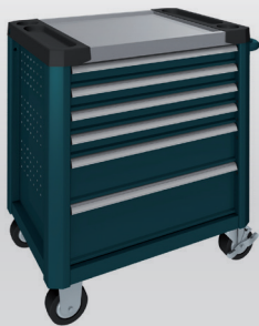
Bleu océan RAL 5020