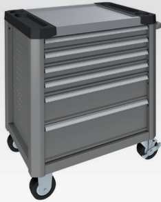
Aluminium gris RAL 9007