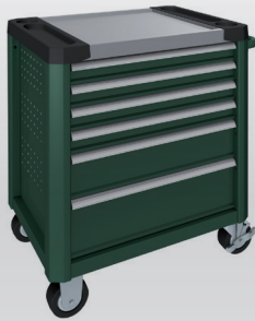
Vert pin RAL 6028