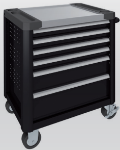
Noir intense RAL 9005

N'hésitez pas à nous demander d'autres coloris. Nous nous tenons à votre disposition pour vous conseiller.