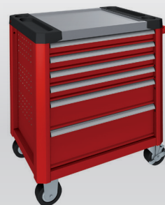
Rouge carmin RAL 3002