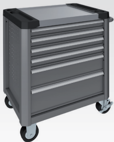
Gris poussière RAL 7037