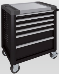
Tiefschwarz RAL 9005

Fragen Sie uns nach weiteren Farbmöglichkeiten. Wir beraten Sie gerne.