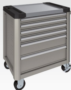
Seidengrau RAL 7044

Aus drucktechnischen Gründen sind Farbabweichungen möglich.