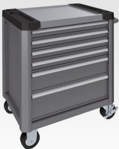
Staubgrau RAL 7037