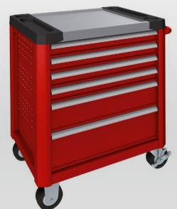
Karminrot RAL 3002