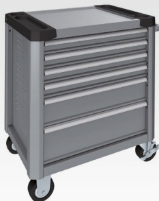
Weissaluminium RAL 9006